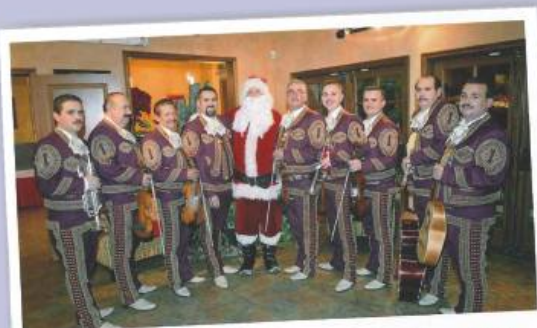
Schurmer & Drane Christmas Party 2010

$1,000,000.00 fue la cantidad del acuerdo por los límites en la responsabilidad de la póliza de seguros para un hombre y su esposa a los que los golpeó por detrás una camioneta en la autopista. Las lesiones fueron en la zona lumbar y en el cuello resultando en una intervención quirúrgica.